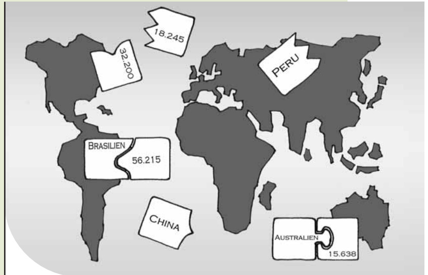
Biologische Vielfalt nach Ländern/Anzahl der Arten höherer Pflanzen, die bisher wissenschaftlich nachgewiesen wurden: